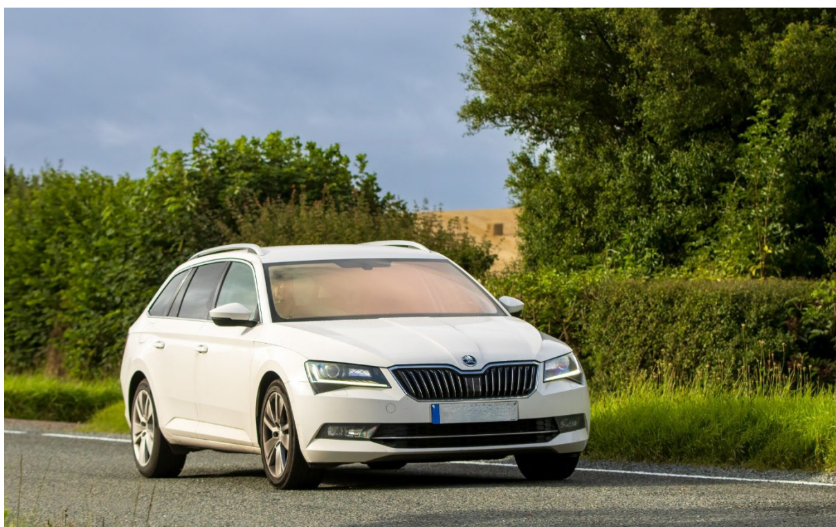
Škoda Superb – ilustračný obrázok

Škrabance, „tukance“ či opotrebovaný interiér síce nelahodia žiadnemu oku, no v porovnaní so zatajenou históriou predstavujú len estetický problém. Ponuka trhu s ojazdenými vozidlami láka na výhodné ceny, rýchlu dostupnosť a nadštandardnú výbavu, ale zároveň skrýva aj svoje riziká. Túžba kúpiť čo najvýhodnejšie vytvára príležitosť pre podvodníkov na neoprávnené obohatenie na úkor kupujúceho. Finančná ujma je pritom len špičkou ľadovca, skutočné riziko, ktorému kupujúci čelia je ohrozenie bezpečnosti vodiča, posádky a cestnej premávky.