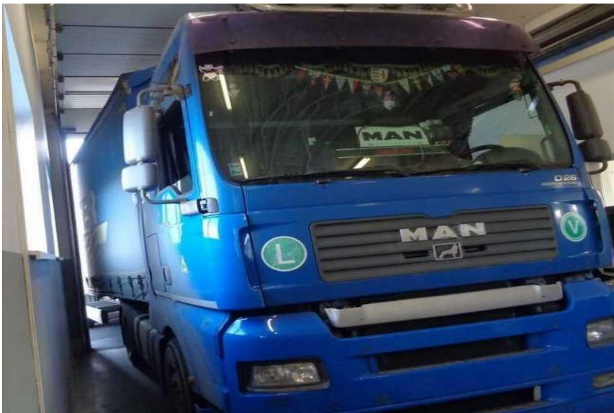
Obr.2: Najazdené kilometre sa stáčajú nielen na osobných vozidlách. Dôkazom je ťahač, ktorý má stočený odometer o takmer 1 milión kilometrov.

RPZV bol zriadený za účelom zaznamenávania stavu odometra pri rôznych životných situáciách počas celej životnosti vozidla. Systém bol vytvorený ako reakcia na neustále sa zvyšujúci podiel manipulovaných odometrov na trhu s ojazdenými vozidlami. Od 20.mája 2018 majú súkromné aj štátne subjekty, ktoré pôsobia v automobilovej oblasti povinnosť zaznamenávať údaje do RPZV. V súčasnosti zasiela do registra informácie viac ako 2.400 prispievateľov od servisov cez autobazáre až po poisťovne a leasingové spoločnosti.