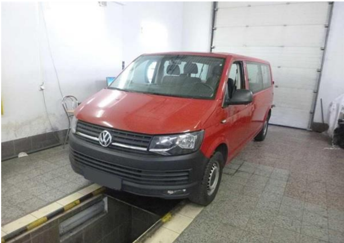
Obr. 1: Vozidlo Volkswagen Transporter prišlo záhadne o vyše 200-tisíc kilometrov.

Podvod s kilometrami pri predaji vozidla z jednej krajiny do druhej sa najčastejšie stáva hneď po prekročení hranice, pokiaľ buď štát vývozu alebo dovozu nemá spoľahlivý štátny register, v ktorom sa dá sledovať a overiť história vozidla. Na podobný prípad upozornil potenciálny kupca z Českej republiky. Uvažoval nad kúpou vozidla dovezeného zo Slovenska. Vyhlíadol si Volkswagen Transporter vyrobený v roku 2016, ktorý mal najazdených necelých 260-tisíc kilometrov. Prostredníctvom výpisu (tzv. ODO-Passu) zo štátneho Registra prevádzkových záznamov vozidiel ( www.rpzv.sk ) zriadeného Ministerstvom dopravy a výstavby SR zistil, že vozidlo má v skutočnosti najazdených o 200-tisíc kilometrov viac.