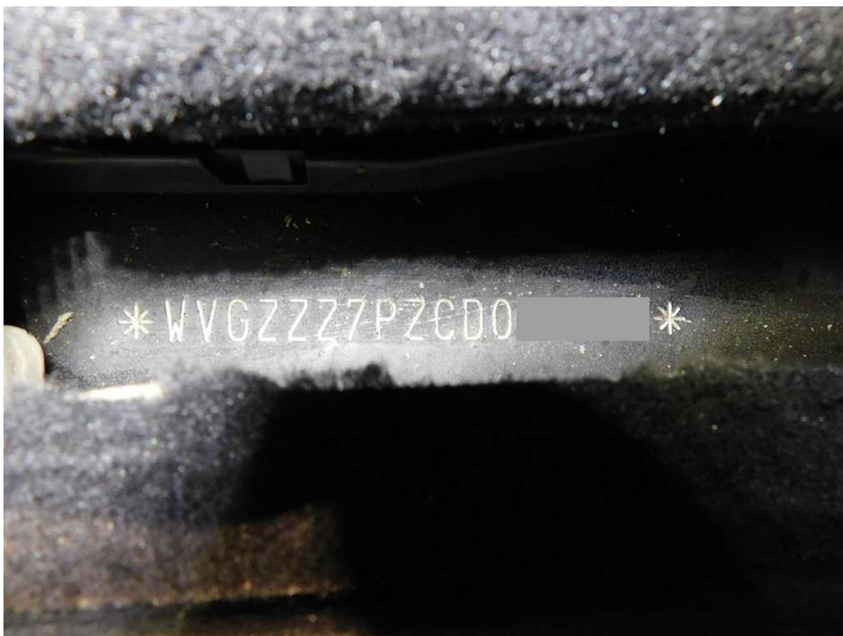
Ukážka VIN čísla.

Overenie kilometrov podľa VIN cez online službu vás môže ochrániť pred podvodníkmi , ktorí sa usilujú manipuláciou s najazdenými kilometrami ohúriť kvalitou a výkonnosťou auta a aj umelo navýšiť jeho cenu.