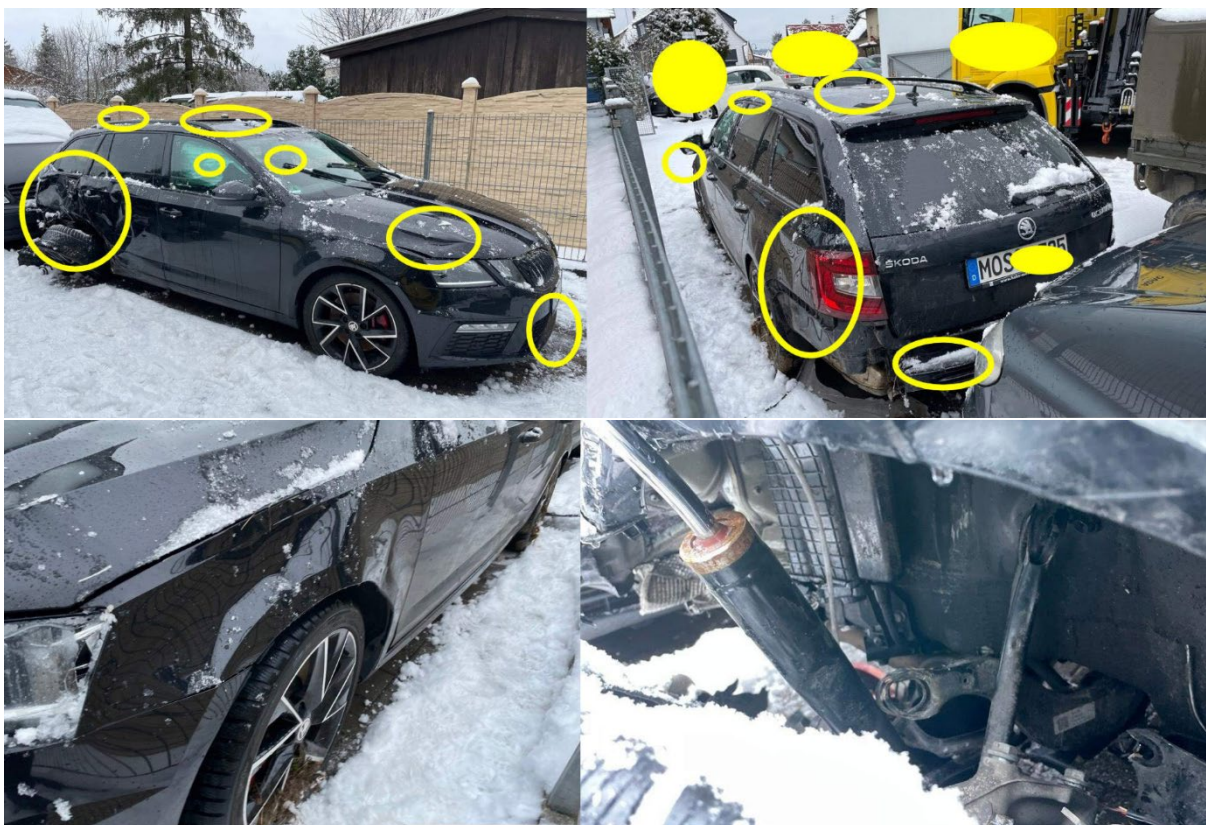
Fotodokumentácia poškodení Škody Octavia z Nemecka zobrazená v AUTO-Passe.